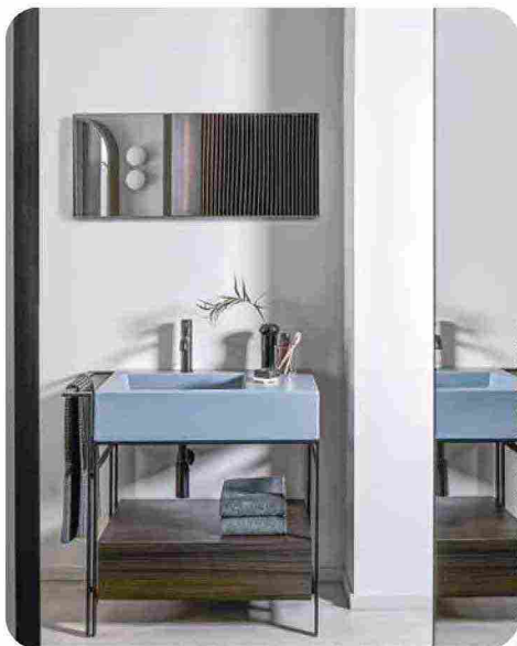
WELLNESS IN TONI FREDDI E CALDI con il mobile lavabo Narciso Mini [Ceramica Cielo, cm 76x50x83h prezzo dal rivenditore].

LA QUALITÀ DELLE SPUGNE si riconosce dalla grammatura indicata sull'etichetta, corrispondente al peso del tessuto calcolato in grammi per mq e che va da un minimo di 350 a 600 gr/mq. Più alta è la grammatura più la spugna è spessa, pesante, soffice, durevole e assorbente per asciugare rapidamente la pelle.