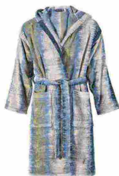
Accappatoio Bridge realizzato in morbida spugna di puro cotone 380 gr/mq [Carrara da €120].