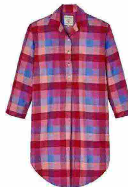
Camicia da notte Coral Shire Square, realizzata in cotone garzato dalla superficie soffice e calda [British Boxers € 110,95].