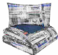
Parure copripiumino Coll. GenZ in percale di puro cotone con stampa digitale nel colore Grigio Corallo [Fazzini € 185 il 2 piazze].