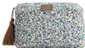
Pochette da bagno Teiki in velluto di puro cotone organico certificato GOTS e OCS [Louise Misha, cm 26x10x18h da €46].