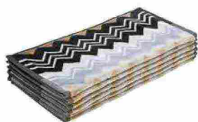
Set da 6 lavette Giacomo in spugna di puro cotone Velour, qui nella variante colore Nero [Missoni Home, cm 30x30 €85].