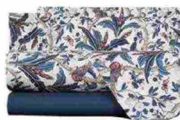
Completo lenzuola Paradise's Bird in percale di cotone morbido e setoso al tatto [Mirabello da € 169 il 2 piazze].