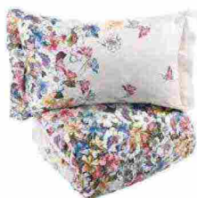
Parure copripiumino Serra in 100% cotone pettinato di alta qualità con stampa digitale fiorita [Caleffi da € 150 il 2 piazze].