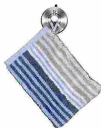
Guanto per doccia Noblesse Harmony Stripes 1085 in soffice spugna di cotone Oeko-Tex® da 578 gr/mq [Cawö, da €6,50].