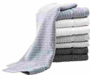
Teli Stripe in spugna di puro cotone idrofilo 470 gr/mq, disponibili anche come set viso [Caleffi, cm 100x150 da €33,50 l'uno].