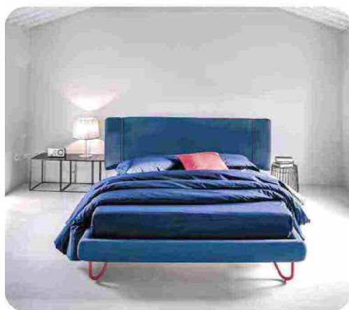
SOGNI IN BLU E ROSSO CORALLO con il letto Hug Two, qui con rivestimento Antara 09 [Noctis, cm 177/212x215x109h € 2.000].

LE CERTIFICAZIONI SULLE ETICHETTE servono a riconoscere la qualità e la sostenibilità di biancheria e rivestimenti. Oeko-Tex® Standard 100 assicura che, dal filato al capo finito, non siano usati coloranti tossici e sostanze nocive per pelle e salute. GOTS e OCS certificano l'uso di fibre organiche e/o biologiche.