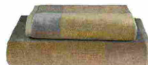
Coppia asciugamani Cromatismi in spugna 500 gr/mq, qui nel colore Verde-Ocra [Fazzini, cm 40x50 e cm 50x100 €27].