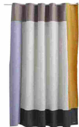
Tenda per doccia Pivot in cotone Oeko-Tex® con trattamento idrorepellente. Qui è nel colore Creme [Hay, cm 180x200h €79].