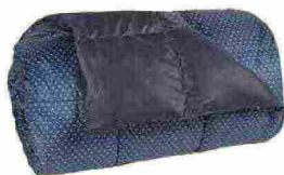
Plaid Soft in puro piumino d'oca bianca ungherese, leggero ma dal calore avvolgente [Cinelli Piume e Piumini, cm 140x200 € 170].